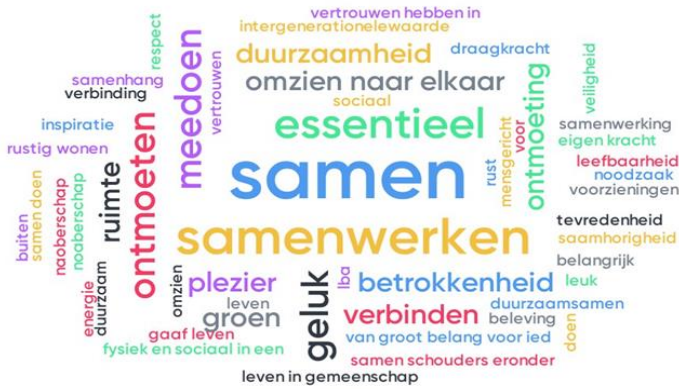
Wordle PlattelandsParlement 2019